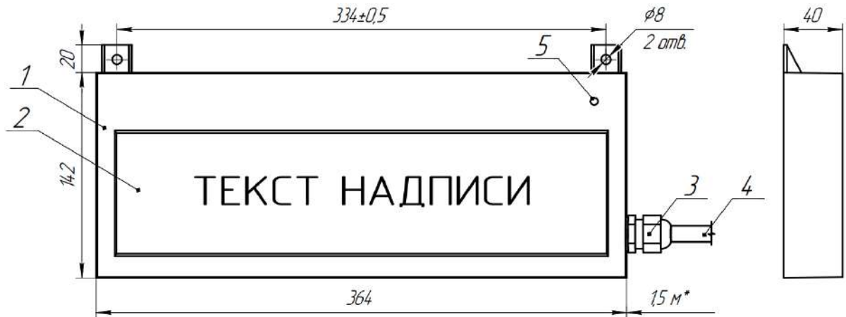
1 - корпус; 2 - прозрачное окно; 3 - кабельный ввод; 4 - кабель питания; 5 - индикатор (светодиод "Сеть")